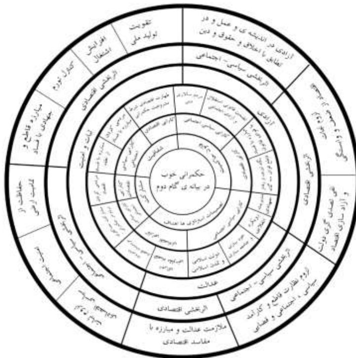
شکل ۳- الگوی حکمرانی خوب در بیانیه گام دوم انقلاب اسلامی

گام اول انقلاب اسلامی از نقطه صفر آغاز شد و پس از تثبیت و گذراندن مراحل اولیه نظام‌سازی در راه دولت‌سازی اسلامی به مسیر پیشرفت خود ادامه می‌دهد. تا به مرحله‌نهایی در گام دوم یعنی تمدن‌سازی اسلامی دست یابد. علیرغم فشارها منحصر به فرد خارجی نسبت به ایران و مشکلات داخلی، این انقلاب ضمن اشتراکات با دیگر حکمرانی‌های دنیا، ویژگی‌های متمایز خود را یافته است. بیانیه گام دوم دربرگیرنده شاخص‌هایی برای ادامه مسیر در دهه‌های پیش رو است. در بیانیه ویژگی‌های گام اول انقلاب اسلامی شامل هدایت و رهبری الهی، فقدان تجربه پیشین، تبدیل سلطنت استبدادی به حکومت مردم‌سالاری، میدان‌داری جوانان در عرصه مدیریت، ایجاد دنیای سه قطبی به جای دوقطبی، مطرح کردن دین و دنیا در کنار هم و ویژگی‌های مرحله نظام‌سازی و پس از آن تا دولت‌سازی اسلامی شامل اتکا به توانایی داخلی، ورود عنصر اراده ملی به مدیریت کشور، تأمین امنیت، به اوج رسانیدن مشارکت مردمی و مسابقه خدمت‌رسانی، ارتقای