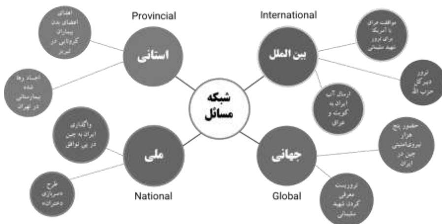
تصویر (۴): شبکه مسائل اخبار جعلی

به عنوان نمونه چند مورد اشاعه اخبار جعلی و اکاذیب در این فضا توسط کاربران ایرانی و خارجی تحت حمایت آمریکا علیه کشورمان در تصویر شماره (۴) ذکر شده است که عده‌ای در داخل کشور به این اخبار کذب دامن زده‌اند، در صورتی که طبق قوانین داخلی آمریکا ممنوع و این کاربران مستوجب اعمال قانونی هستند.