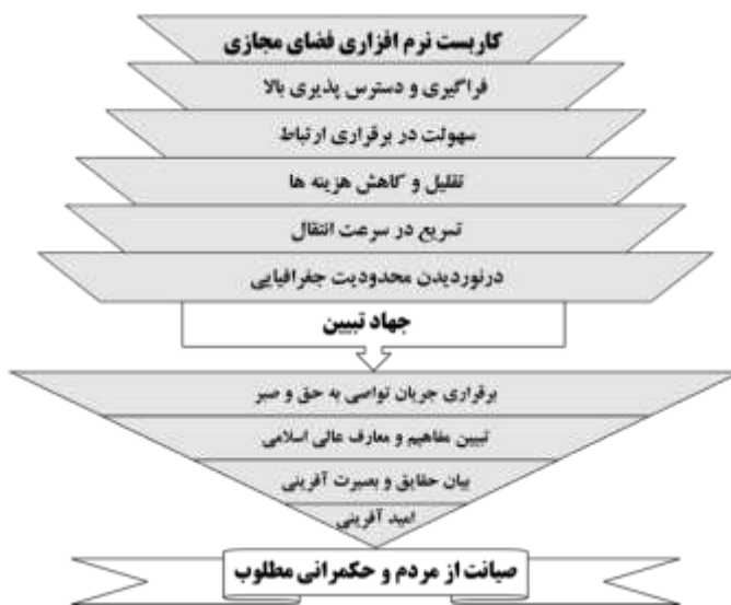
تصویر (۵): مدل پژوهش

و جریان اطلاعات در میان انسان‌ها قرار می‌گیرد. با این تفاسیر، بهره‌گیری از جنبه نرم‌افزاری آن راهبردی خطیرتر بوده که دستورکار جهاد تبیین ناظر به جنبه معنای و محتوایی آن و نیز در جهت تقویت و ارتقای آن می‌باشد.