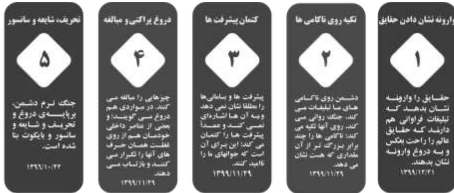
تصویر (۲): تکنیک‌ها در جنگ نرم

سیستم را درگیر تغییر یا حفظ نظام مستقر سازد، جنگ نرم به شمار می‌رود (حسینی، ۱۳۸۹: ۴۱). کارکرد جنگ نرم برای ایجاد فضای هیجانی و بهره‌برداری سریع از فضای هیجانی ایجاد شده است. برای همین، تاکتیک‌های متفاوتی برای مواجهه با مسائل متفاوت است.