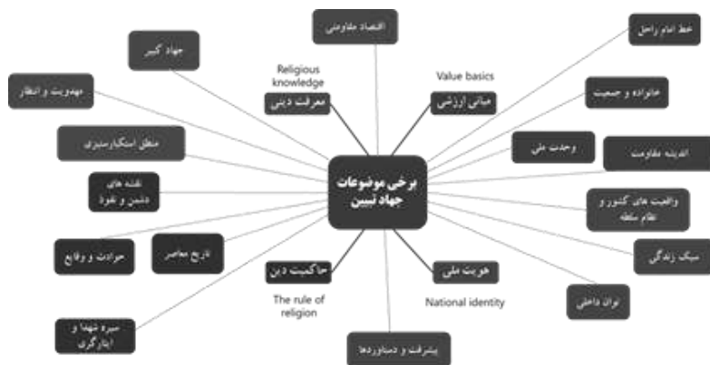
تصویر (۶): موضوعات جهاد تبیین

جهاد تبیین در عرصه جنگ نرم یکی از راهبردها و سلاح‌هاست و به نظر رهبر انقلاب امروز آن چیزی که می‌تواند به بهترین وجهی به صورت یک سلاح مؤثری عمل کند، تبیین مفاهیم عالی اسلامی در زمینه‌های مختلف معرفتی، سبک زندگی، محیط زیست و خانواده است. در همه‌ی این‌ها اسلام حرف‌های جذاب دارد که می‌شود از درون متون اسلامی تخلیص و تجرید کرد و در اختیار همه گذاشت (رهبر انقلاب، ۱۴۰۰/۱۲/۱۹). در زمینه‌های اجتماعی، فعالیت‌های اقتصادی، دیپلماسی و سیاسی، عمرانی؛ هر کدام از این سرفصل‌ها می‌تواند یک عنوانی برای فعالیت جهاد تبیین باشد (رهبر انقلاب، ۱۴۰۰/۱۱/۱۹). لذا یکی از کارهایی که امروز به شدت در برنامه‌ریزی‌های دشمنان انقلاب و نظام جمهوری اسلامی مطرح است، حساسیت‌زدایی مردم نسبت به اصول و بینات و مبانی انقلاب از راه همین تبلیغات وسیع در فضای مجازی است. این هم در رسانه‌های جمعی بیگانه به انواع مختلف انجام می‌گیرد (رهبر انقلاب، ۱۴۰۰/۱۰/۱۹). یکی از موضوعاتی دیگر که بسیار مهم و می‌توان مطرح کرد، مسئله‌ی آئین حکمرانی اسلامی است. حکمرانی در منطق اسلام از بن و بنیاد با حکمرانی‌های رایج جهان متفاوت است؛ مردمی، دینی، اعتقادی، اشرافی نبودن، مسرف نبودن، ظالم نبودن: در این دعا‌های صحیفه‌ی سجّادیه ۱ هست؛ کلمه‌کلمه‌اش مبانی مهم معرفتی است؛ چیزهایی که سلاح‌های جدید است، باید استفاده کرد (۱۴۰۰/۱۲/۱۹). به عنوان نمونه برخی موضوعات در تصویر شماره (۶) آمده است.