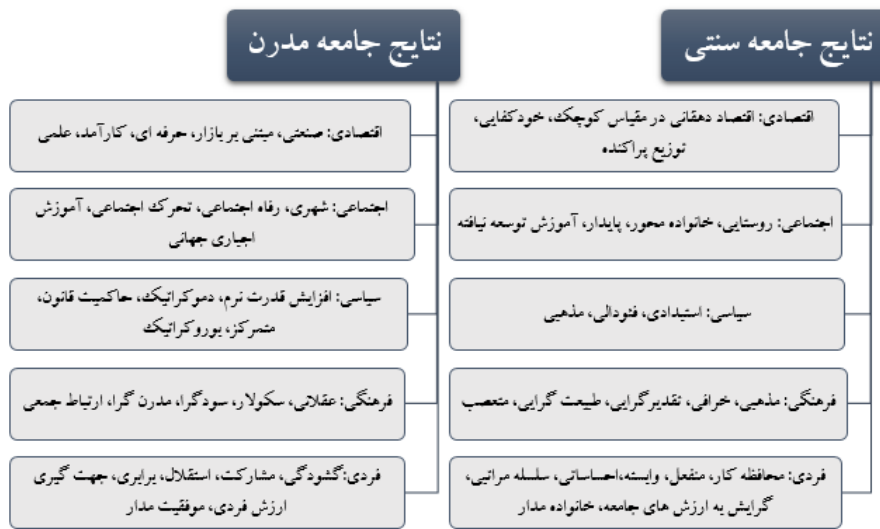
نمودار ۱: مقایسه نتایج جامعه سنتی و جامعه مدرن. منبع: He Chuanqi, Orient Renaissance , 2003.

عقلانی سازی، جهانی سازی آموزش اجباری ابتدایی، گسترش استفاده از رسانه های جمعی و غیره. (He 2003:98)