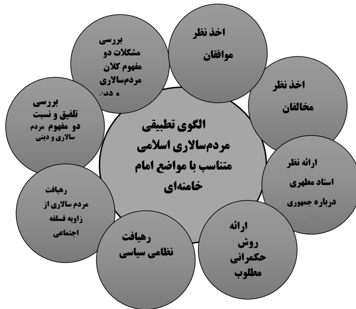
شکل شماره 1: ویژگی‌های الگوی تطبیقی مردم‌سالاری اسلامی متناسب با مواضع امام خامنه‌ای (منبع: مؤلفین)