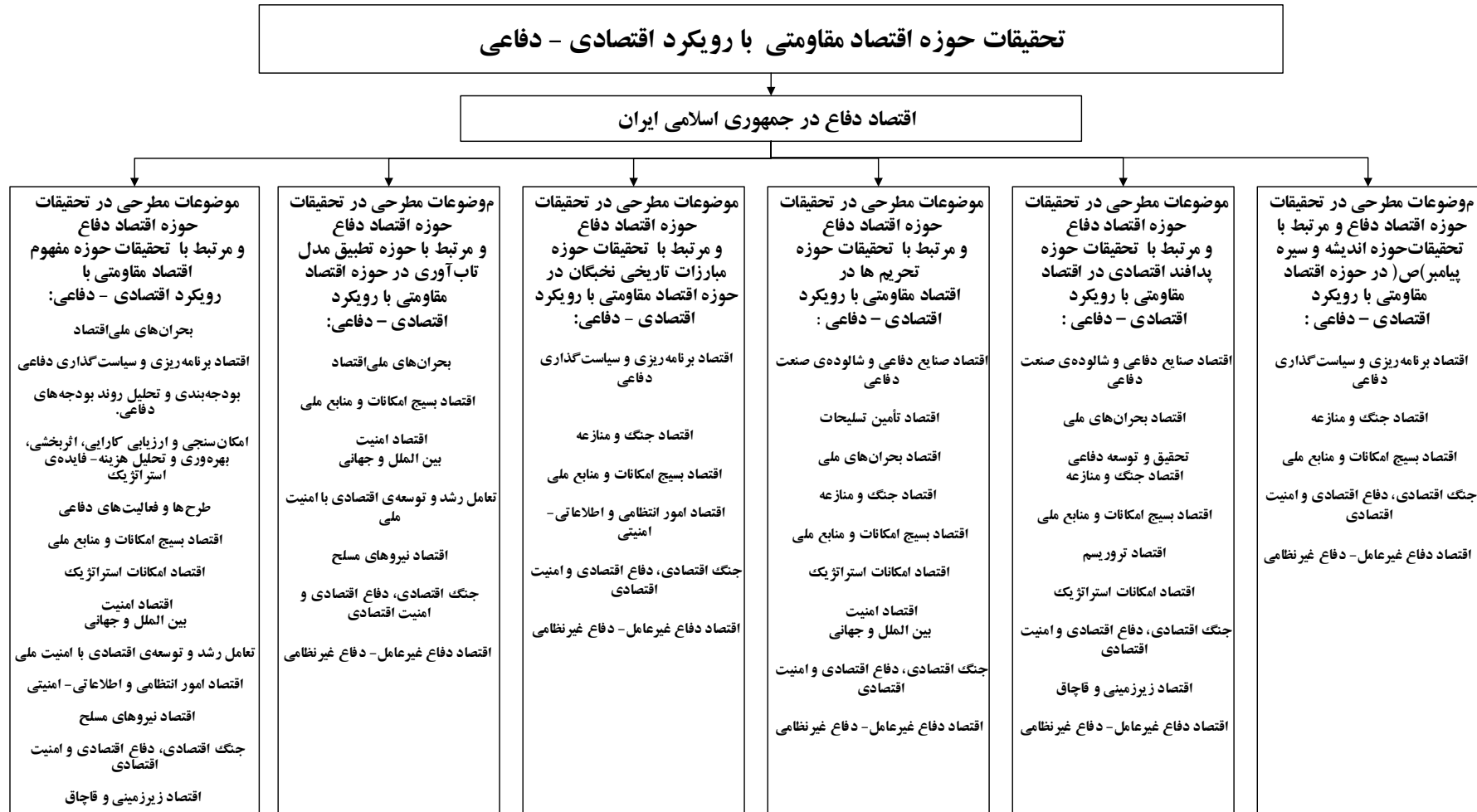
شکل 3. دسته‌بندی تحقیقات اقتصاد مقاومتی با رویکرد اقتصادی - دفاعی به صورت 6 دسته تحقیقات زیر مجموعه اقتصاد دفاع